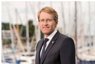
Daniel Günther MdL Vorsitzender der CDU Schleswig-Holstein Ministerpräsident des Landes Schleswig-Holstein